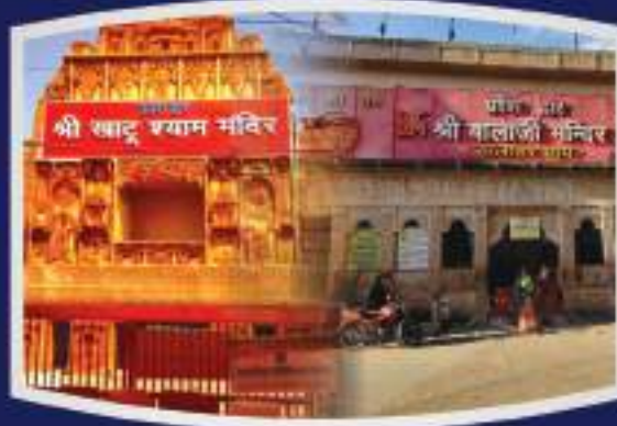
श्री खाटू श्याम जी, श्री सालासर धाम