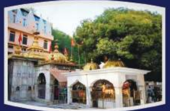
माता ज्वाला जी