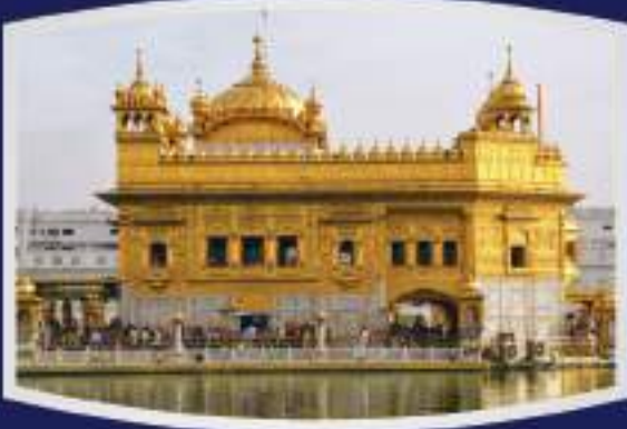
श्री अमृतसर साहिब

पंजाब सरकार द्वारा धार्मिक स्थलों के निःशुल्क दर्शनों हेतु विनम्र प्रयास