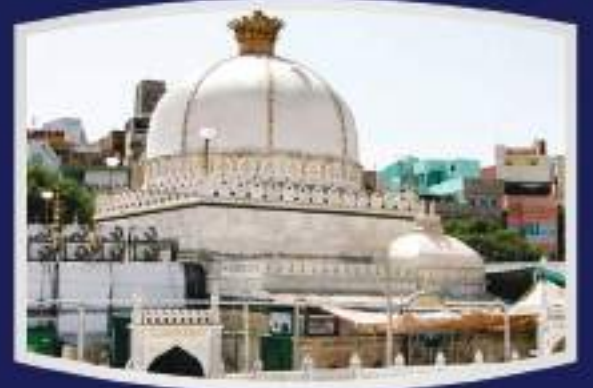
ख्वाजा अजमेर शरीफ़ दरगाह