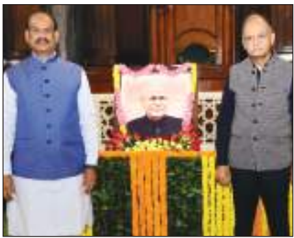
लोकसभा अध्यक्ष ओम बिरला ने संविधान सदन में लोकसभा के पूर्व अध्यक्ष रवि राय को उनकी जयंती पर पुष्पांजलि अर्पित की।