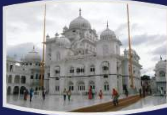
श्री पटना साहिब