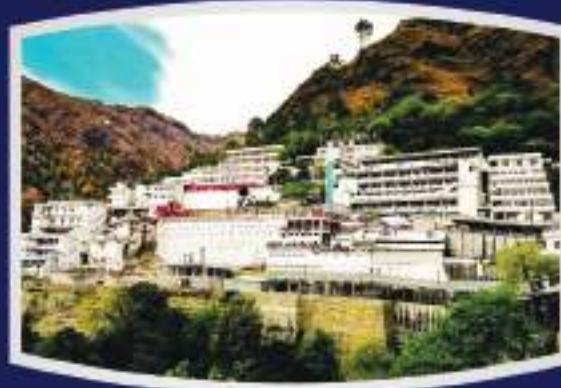
माता वैष्णो देवी जी