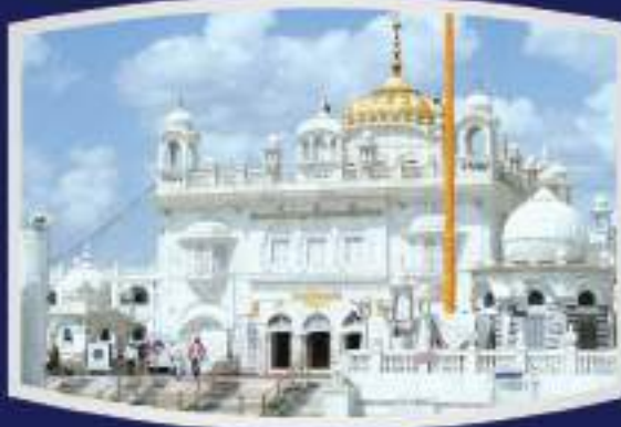
श्री हज़ूर साहिब