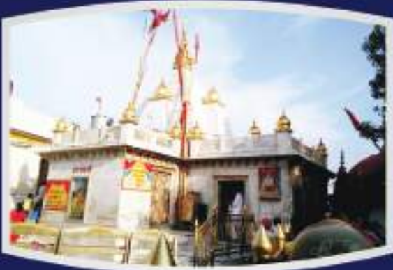
माता नैना देवी जी