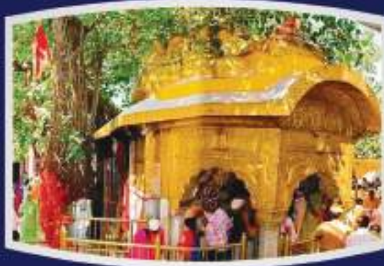
माता चिन्तपुरणी जी