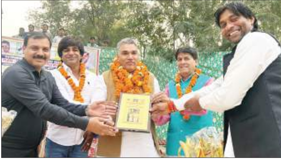
में बोके फाइटर क्लब प्रथम आया। इस प्रतियोगिता के समापन पर मुख्य अतिथि के रूप में पधारे