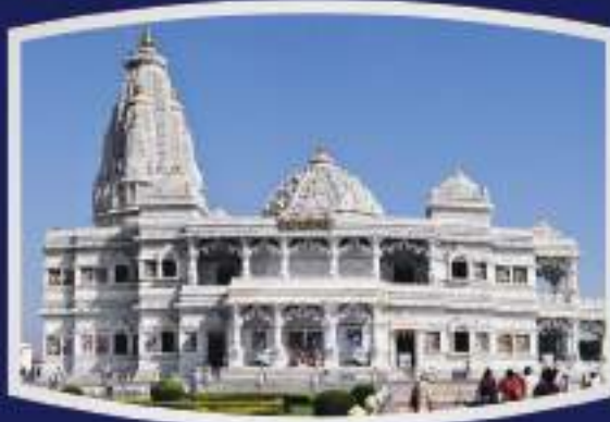
श्री वृंदावन धाम