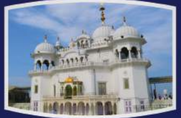
श्री आनंदपुर साहिब